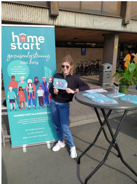
Flyeractie op de avondmarkt in Diest