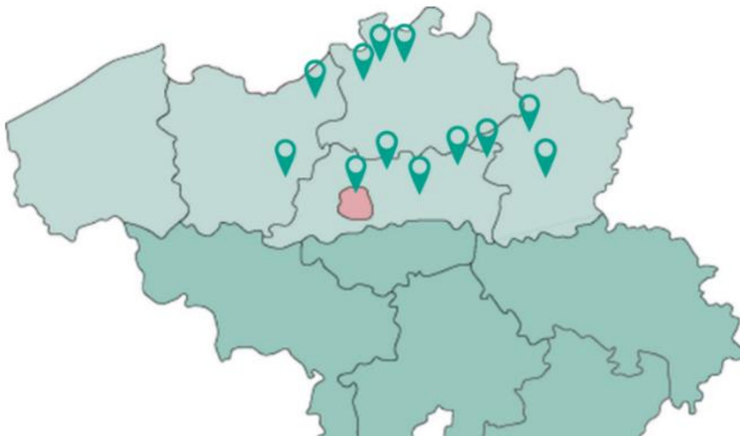
Kaart: Domo in Vlaanderen

De Domobeweging in Vlaanderen bestaat verder uit 3 actieve vzw's: Domo Antwerpen, Domo Hasselt en Domo Waasland. Daarnaast is er een autonome werking, Domo Voorkepen (samenwerkingsverband tussen de gemeenten Brecht, Schilde, Wijnegem, Zandhoven, Zoersel).