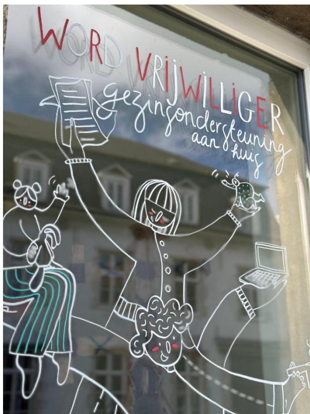
Raamtekeningactie i.s.m. 11 horeca- en handelszaken in Leuven in november