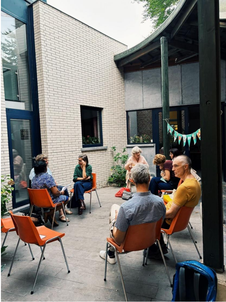
Een zomers taalterras voor de Leuvense en Herentse taalmaatjes