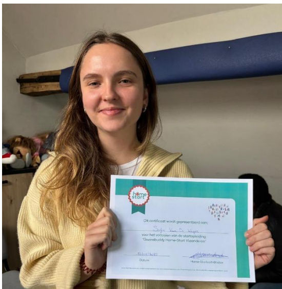
Leuvense vrijwilliger met een certificaat van deelname aan de drie startopleidingen van Home-Start Vlaanderen