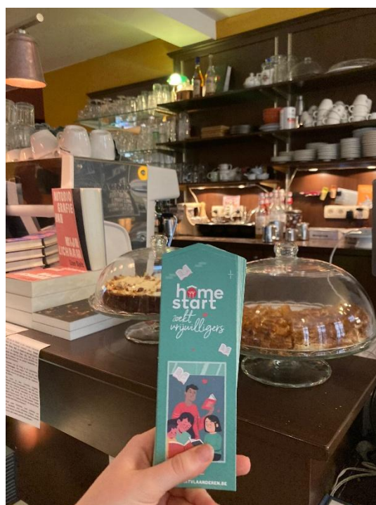
Bladwijzers in boekenwinkel Barboek en Boekarest i.k.v. jeugdboekenmaand