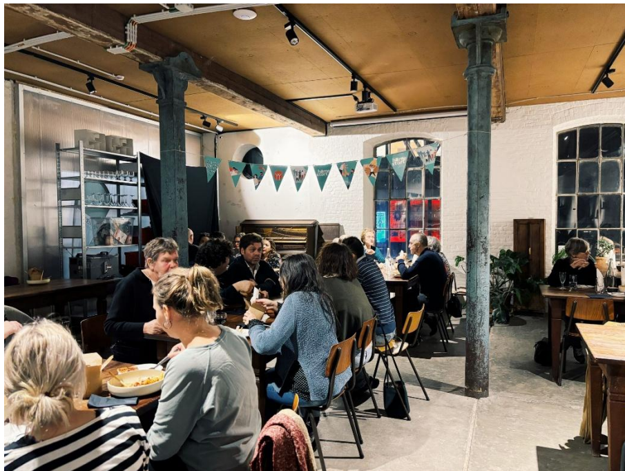
Dankentje voor de Leuvense Home-Startvrijwilligers in november