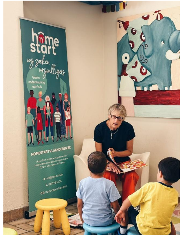
Home-Start Leuven houdt halt in de filialen van de bib en organiseert een voorleesmoment met een Home-Startvrijwilliger in september