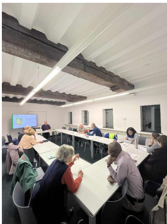
Vorming rond duidelijke mondelinge taal voor vrijwilligers i.s.m. Agentschap Intergratie en Inburgering