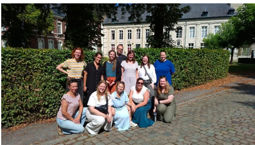
Team Home-Start Vlaanderen op de teamdag in de Abdij van Vlierbeek