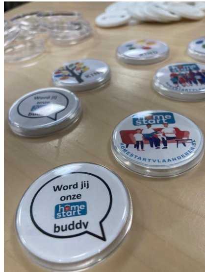
November 2022: Opendeurdag Huis van het Kind