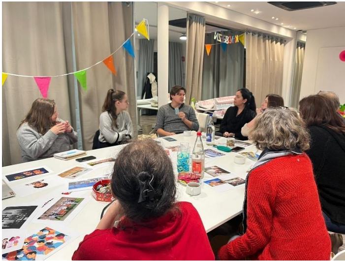
CC Het Gasthuis komt uitleg geven over de Uitpas.