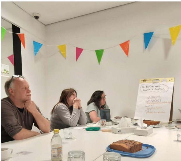
Straf denk- en praatwerk tijdens de intervisies