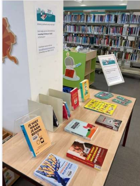
Standje met boeken over opvoeding tijdens de week van de opvoeding in de bib (promotie voor infomoment)