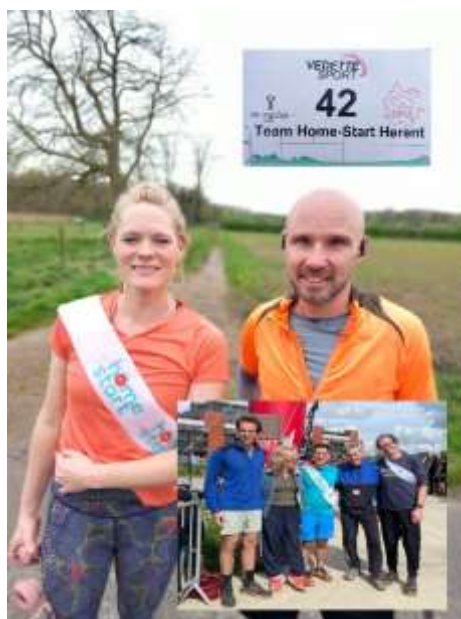
Deelname aan Jogclub Ultra