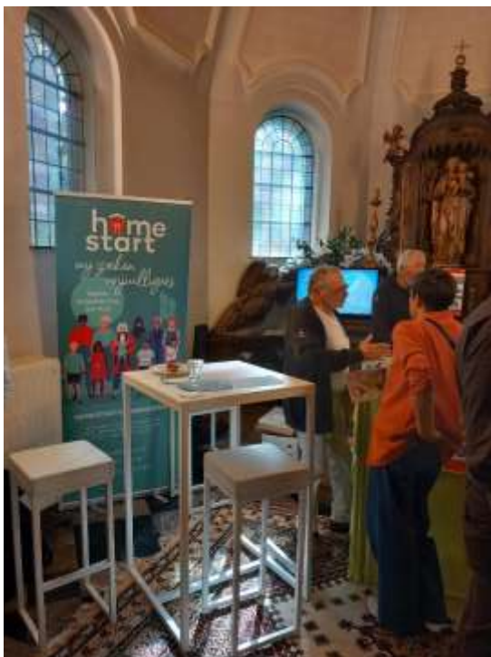
Aanwezigheid op forum ELZ Leuven Zuid