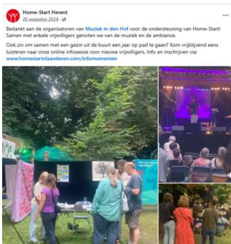
Toelichting werking Home-Start en promotie tijdens Muziek in den Hof