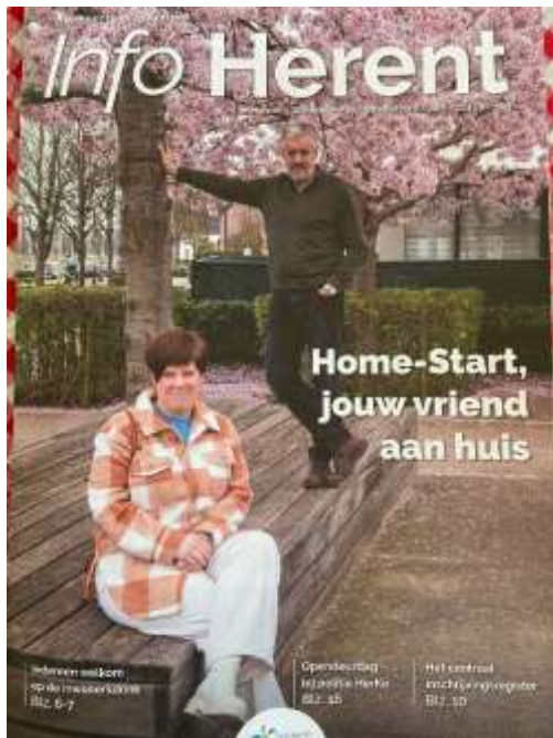
Interview met twee vrijwilligers in Info Herent