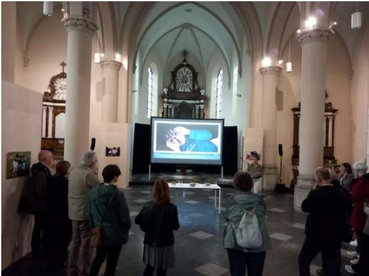
Fototentoonstelling 'Gedeeld en betrokken ouderschap' in de Kerk van Veltem