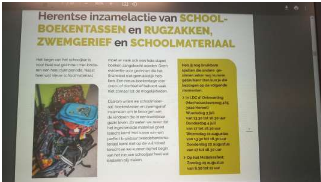
Inzamelactie boekentassen door vrijwilliger tijdens Mollekensfest (artikel in Info Herent)