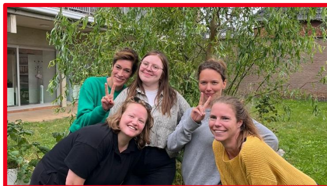
Team Leuven samen met de collega's van de centrale werking