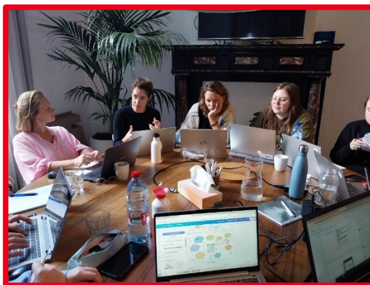
Home-Start op bezoek bij Bednet