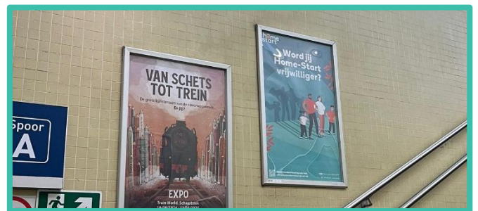
Home-Startaffiches in het station van Leuven