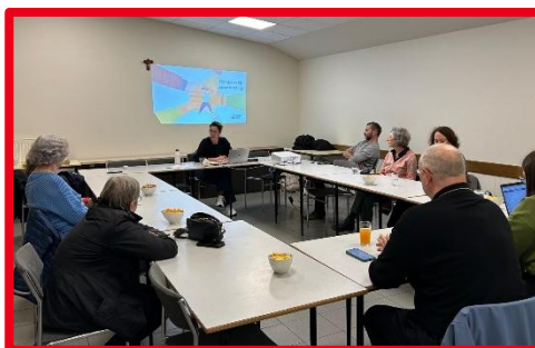
'Omgaan met verontrusting' vorming voor vrijwilligers