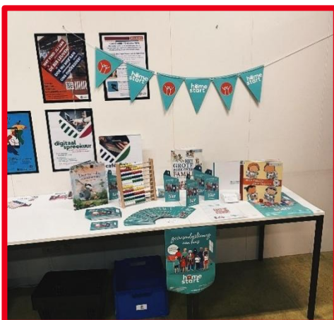
Home-Starttafels in de filialen van de Bib in september