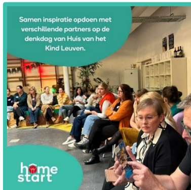
Denkdag van Huis van het Kind