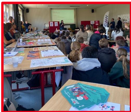
Vrijwilligersmarkt op Sociale Hogeschool Heverlee