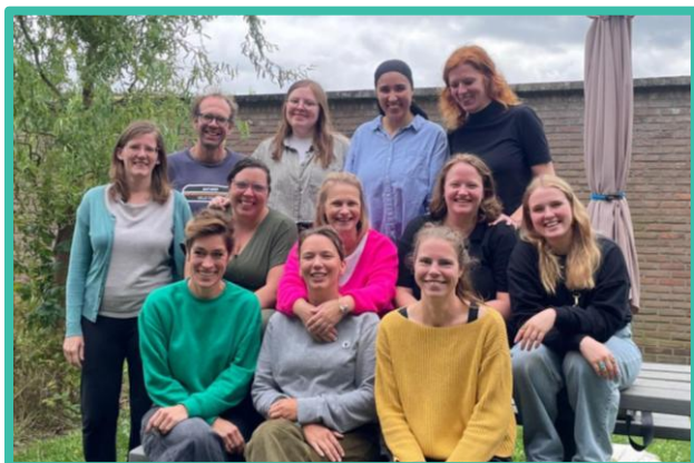
Team van Home-Start Vlaanderen op de teamdag in Diest