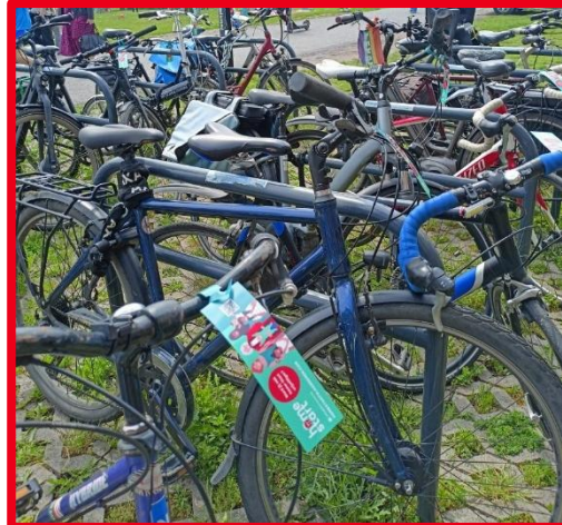
Fietsflyeren op het Mundo Moves Wereldfeest in februari