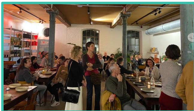
Bedankingsentente voor Leuvense vrijwilligers