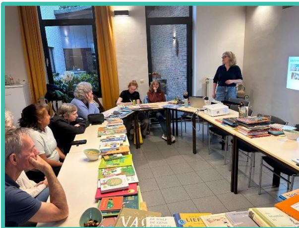
Vorming voorlezen voor Leuvense Home-Startvrijwilligers in mei