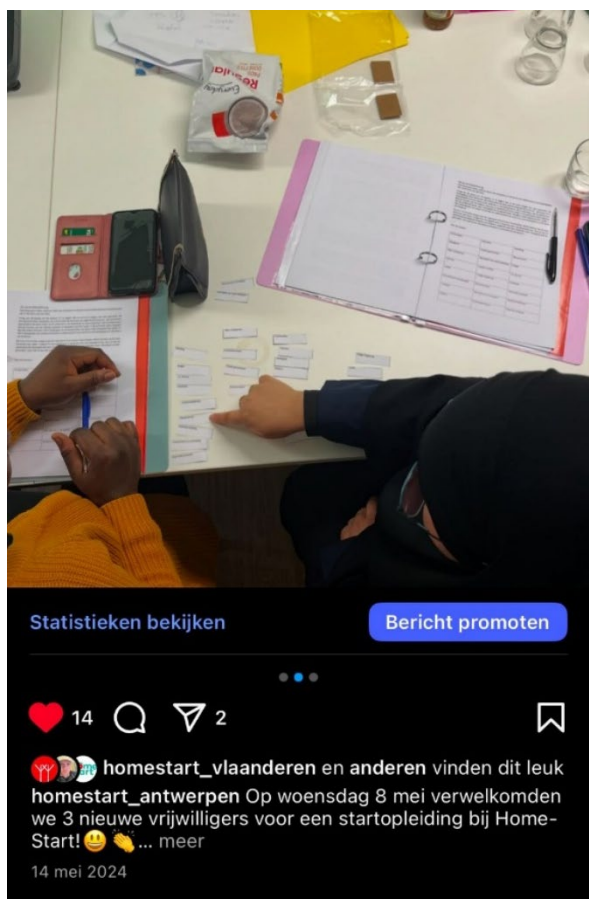
Startopleiding voor nieuwe vrijwilligers