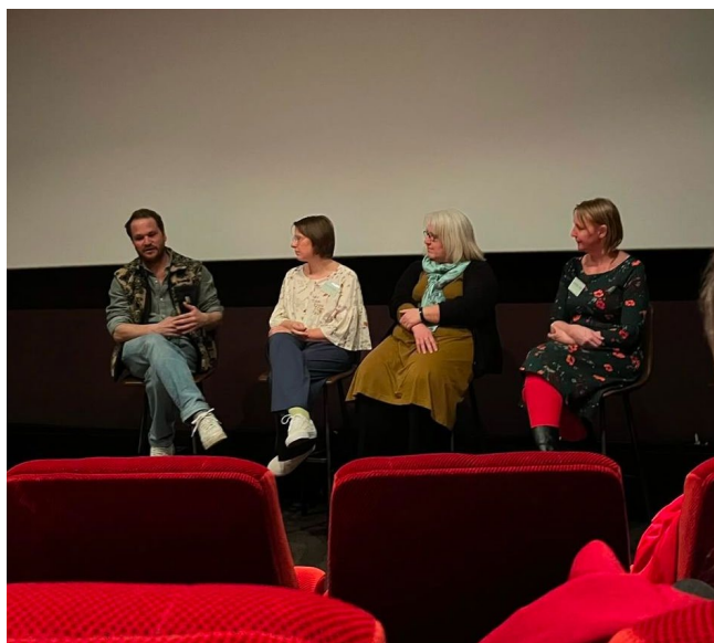
Filmbespreking Holy Rosita in Cinema Cartoon's